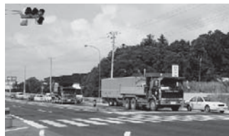
車の通らない51号交差点で定期的に赤になる新設信号

完成まで程遠いと思われまし、道路をふさいでも何ら支障があるように思えません。第2に信号がセンサー(感応)式になってないことが挙げられます。交通量の少ない交差点は通常はセンサー式のみを感知して自動的に信号を切り替えるのが国際的常識になってきています。それが無いために進入車両が全くないにも関わらず赤に変わるので、51号線の車フローを無意味に止めてよいのでしょうか?51号線を毎日何度も行き来する多くの市民にとって、ずさんな信号の設置は大変な迷惑です。