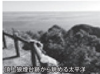
頂上狼煙台跡から眺める太平洋

今日、過疎化が進んでいる竹ヶ島では、お祭りの季節でも神輿を担ぐ若手が足りず、海中神輿の祭りを継続することが困難になっています。そして2017年、残念ながら海中神輿の行事は中止に追い込まれてしまいました。由緒ある竹ヶ島の海中神輿の背景には、何等かの大切な歴史的イベントが伴ったに違いありません。だからこそ、冷たい海中にまで重たい神輿を担ぎ、そして神を祀ることを大切に人々が存在し、世代を超えて今日まで語り継がれてきたのではないのでしょうか。竹ヶ島には多くの魅力が秘められています。