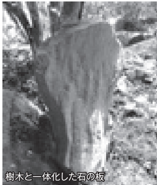
樹木と一体化した石の板

場所が、島の聖地である竹ヶ島神社奥宮の磐座から見て、その真上に位置することに注目です。海岸沿いの奥宮から急斜面をまっすぐに上り詰めると、この「坊主岩」に辿り着きます。その真下には環状列石のように直径3mほどの円形に連なる石があります。自然に円の形状を成したのか、それとも人の手によって意図的に円を描くように置かれたかは定かではありません。いずれにしても、島の頂上そばであることから、古代の祭祀場としては恰好の位置づけを有する巨石と考えられます。