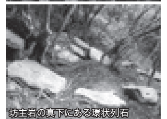
坊主岩の真下にある環状列石