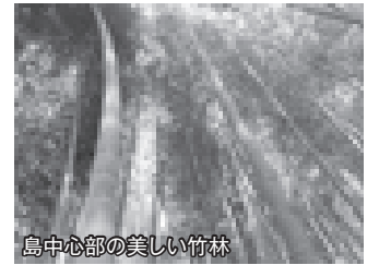
島中心部の美しい竹林

竹ヶ島の南部から東方の太平洋岸にかけては岩場が広がり、周辺は大小無数の岩石によって囲まれています。そして島内でも随所に岩石が露出しており、高低差の激しい太平洋に浮かぶ離島であることからしても、この小さな島の中心地にはのみ竹林が自然に生い茂る可能性は極めて低くはまずです。その島のど真ん中に竹林が蔽い茂っている訳ですから不思議とし