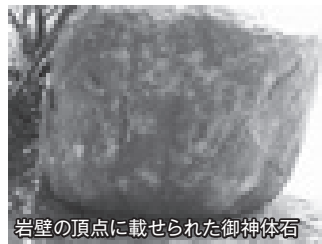
岩壁の頂点に載せられた御神体石

竹ヶ島神社の由緒は不透明ですが、遭難船が神に助けられたという地元の伝承が残されています。ある荒天の夜、竹ヶ島沖で遭難した船が遠くに光を発している何かを見つけ、それを頼りに岸まで辿り着き、無事難を逃れたことができたことから、島の人々が浦磯の奥の岩場に祠を建て祀ったことが、竹ヶ島神社の起源と言伝えられてきたそうです。それ故、いつの日でも航海の無事と大漁を願い、竹ヶ島の人々は島の東岸にある岩場の祠に集い、そこで神の御加護を祈念してきました。そして後世になって、現在の場所に竹ヶ島神社が建てられることになりました。