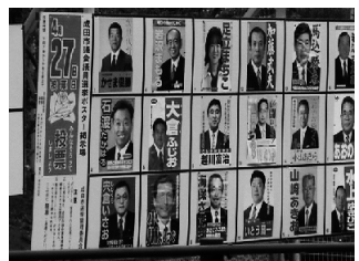
選挙ポスター掲示板は今時本当に必要か?

また選挙の宣伝カーはもう禁止しませんか? 町中が大変うるさいですし、車上から複数の立候補者とその家族、後援会の方々から手を振られても気持ち悪いです。投票者には立候補者の行政に対する姿勢、考えがはっきりわかれば良いのです。国際都市、成田に必要なのはポスターでも宣伝カーでもなく、立候補者同士の公開討論の場ではないでしょうか。