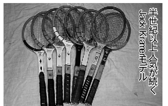
半世紀以上大会が続くJack Kramerモデル

ドマークとなりました。それを機に金属製ラケットのブームに火がつき、それまで国内メーカーとして人気の高かったKawasakiやFujiyamaが徐々に市場から姿を消し始め、Yonex社のように金属ラケットを主体としたメーカーがシェアを伸ばしたのです。海外ではその後、Prince社が頭