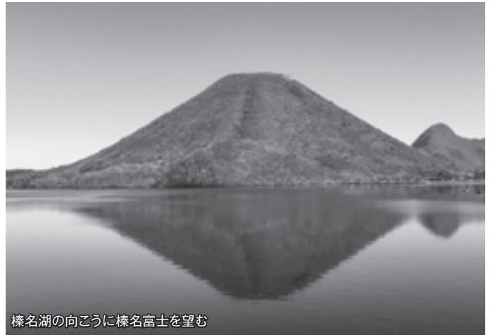
榛名湖の向こうに榛名富士を望む

その直後、中学校に入った長男と、小学校3年生の次男がアイスホッケーを始めたことから、ならば子供達と一緒に