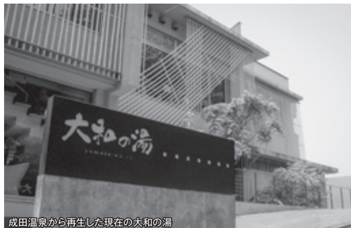
成田温泉から再生した現在の大和の湯