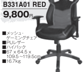
B331A01 RED 9,800円

■メッシュ・ゲーミングチェア ■PULレザー ■ハイバック ■67 x 64.5 x 109.5~119.5cm ■16.7kg