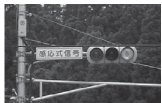
不動ヶ岡51号沿いに新設された定期的な赤信号になる「感応式信号」

が30秒もあり、副路からの車が殆ど無く、人通りも全くないことを考慮すると長く感じられます。常識的には横断歩道を渡る程度の時間で信号が変わればよいはずですが。しかも歩行者の横断用ボタンは押してもすぐに反応しません。不必要に赤信号が増えることは大勢のドライバーが迷惑するだけでなく、大気汚染、騒音問題、及びエネルギーの浪費につながります。道路拡張工事は交通の流れをスムーズにするために行われたのですから警察の交通課はもっと関心をもって取り組むべきではないでしょうか。