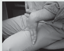
太ももを指ではさんで鍛錬の図

「ギターが上手い人は指が長い」と思っている方は多いのではないのでしょうか。しかし世の中には手が小さい人や女性でも無茶苦茶うまい人が大勢います。結論から言うと指の長さより指の関節が柔らかくて、どれだけ指が開くかということが重要です。どんなことでもそうですが、練習なくして上達なし。でも会社や学校が忙しくて家で十分な練習時間が確保できない方も多いはず。今回はギターがなくても生活の中でちょっとした努力で出来る効果的な練習法をご紹介します。これは主に指を開くようにすることと、滑らかに動かすことが目的です。まず指を開く練習ですが、人差指と中指をV字に開き、太ももを挟みます。指がグワッと開いてそのうち指の付け根が熱くなります。無理は禁物ですが、なるべく長い時間続けましょう。順に中指と薬指、小指と続けていきます。その他には指をポキポキ鳴らす方法もあり、これは指の関節を柔らかくするのに効果的です。各指を独立させて速く動かす為のトレーニングでは、5本の指を軽く曲げて机の上に置き任意の指を素早く連打します。動きにくい薬指も練習次第で速く動かすことができます。またコードを押さえた形を空中で作る「空中フォーム」という練習法もあります。これは難しいコードも一瞬で指のフォームを切り替えられる為の練習で、会議中でも通勤途中でも気軽に出来ます。さらにビブラートを滑らかにする為に掌を軽く握って肘から先を回転させる方法もあります。これは右手でやるとトレモロピッキングの鍛錬にもなります。ちなみにギターを弾いて練習する場合は、指や腕が一番リラックスしているお風呂上りをお勧めします。こうした楽器を持たない楽器の練習法はギター以外にもあるでしょう。もし面白い練習法をご存知の方は教えて下さい。あ、ちゃんと仕事はしてますよ。