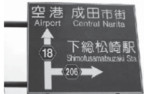
「しもふさまつざき」と書かれている標識

すね。それを実証するがごとく、駅前の県道沿いの2つの大きな道路図には確かにアルファベットでShim ofusa Matsuzakiと書いてあります。ところが駅前の通りに入って駅の表札を見ると、そこには同じくアルファベットでShim osa Manzaki,すなわち「しもさまんざき」となっています。実はこれが正しい読み方であり、県道沿いの看板は読み方が間違っただけで長年放置されているという珍しいケースなのです。間違っただけでなく成田市の恥ですので、早急に修正したいものです。