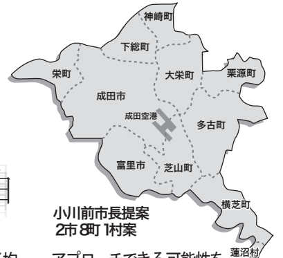
小川前市長提案 11市8町1村案

最後に見逃してならないポイントは、日本が島国であり、日本国民は心のどこかで常にウォーターフロントを求めているということです。世界を見渡すならば、およそ大きく栄えている町の大半は海や湖、川沿いに発展しています。日本列島を見渡してもウォーターフロントに恵まれていない県は関東と中部のごく一部にとどめられます。それ程日本人にとって海や川、湖からなるウォーターフロントは大切な地理的条件なのです。今や成田市にとっても無くしてはならないのが水資源であると断言できます。北は日本を代表する利根川の河川、そして東南にはこれも抜群の知名度を誇る九十九里の海岸に隣接することにより、成田市の将来構想に雲泥の差が生じます。例えばつい最近、都心部と地方を結ぶ物流の手段として利根川の水路を活用する方法が研究され始めました。もしこれが実現すれば輸送コストの節約と交通渋滞の緩和に一役買うことができるだけでなく、陸空だけに頼っていた成田に新たな輸送手段としての選択肢が与えられることとなります。また九十九里はこれから開発が始まるとうしている貴重なシーサイドタウンです。それ故、利根川の広大なウォーターフロントを保有する栄町と太平洋に面する九十九里にアクセスを与える横芝町の存在は貴重です。成田市が空と陸のアクセスに優れた立地条件を備え、更に海と川の双方から