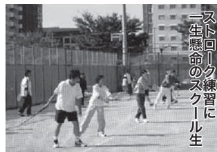
一歩一歩練習に一生懸命のスクール生

ークこそ正に反射神経の勝負と言えます。そしてコートの後方からボールを1回弾ませて打ち合うことをグランド・ストロークと呼びます。これぞテニスマッチの基本であり、ラリーの応酬は傍から見ても楽しいものです。またネット際に詰めてボールをノーバウンドでプレーすることにより、テニス