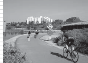
トラックの幅が4mあれば双方で自転車も行き来できる

マラソンとは忍耐の限りを尽くして孤独に走り続け、肉体の限界に挑戦するだけの運動に思われがちですが、実際には走りながら数々のドラマを繰り広げていく楽しいスポーツです。現実問題として最短でも2時間台、長ければ数時間以上の時間を費やして42kmという長距離を走り抜ければならない為、必然的にランナーはコースを走りながら様々な体験を積み重ねていきます。人々の歓声や自動車の騒音を聞き、時間と競争相手に気をかけながら、そして時には考え事をしながら大地を自分の足で走り抜けていくのがマラソンの醍醐味ともいえるでしょう。