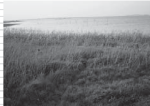
まったく整備されていない成田市側の印旛沼周辺