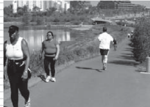
ニューポート・ベイ周辺の4m幅トラックはランニングとサイクリングに最適なコース