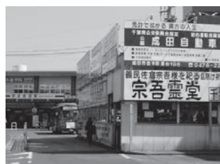
ロータリーの敷地内のバス小屋を何故綺麗に整備しないのか？

いお粗末な施設なのです。無論トイレもありません。そしてこのバス小屋の周囲は車の流動帯がきちんと道路上に表記されていないため、どこをバスが通り、タクシーはどこで待ち、一般乗用車はどこを通り抜けるか、そして人はどこを歩くべきか、さっぱりわからないのです。京成電鉄にとって成田駅は最も大事な顔のひとつであるはずですが、肝心の京成成田駅前をだらしない放置するという事は、一体、どういうことなのでしょう？