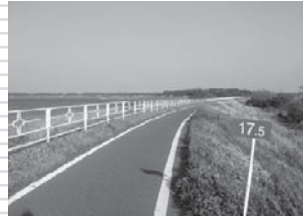
きちんと整備されているが、知名度が低く人気のない印旛村側のサイクリングロード