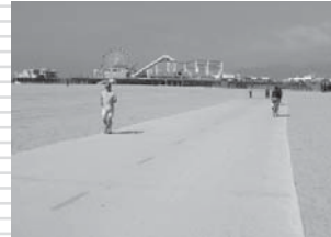
サンタモニカ・ビーチの真中に造られた大型サイクリングロード