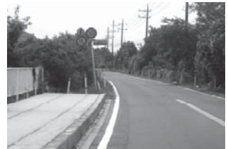
栄町には立派な歩道があっても成田市側では歩道が雑草に変わる!

土地だが、それ以降は県の土地ではないため、今のところ整備する予定は無い」とのこと。そこで歩道が無くなった道路沿いの土地の所有者を調べて見ると、千葉県となっているではありませんか。またそこに建っている1軒の民家の住民は土地を県から借りて住んでいるだけなので、県の要望があれば移動も考えます、という前向きな姿勢でした。この歩道は成田側まで完成する前提で着工したはずですが。単に行政の怠慢が原因で歩道工事がほったらかしになっているにすぎないのです。