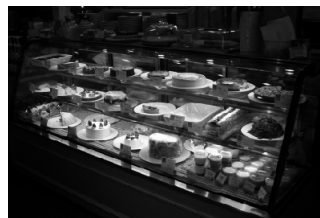
1数種類の自家製ケーキが常に並んでいる豪華なショーケースに誰もが魅了されてしまう!

ルのサラダと、トマトとモッツァレラのスパゲッティーは格別。またランチメニューが豊富なのもいい。お勧めは1260円のビーフステーキ・ランチ。成田でステーキが安く食べられる数少ないスポットだ。またワインリストが豊富で、ボトルをあけてじっくりとワインを味わう雰囲気が店内には漂っている。特筆すべきは自家製ケーキ。あまりの数の多さに何処から買っているの?と聞いてしまいそうだが、何と、全て自前のキッチンで作っているとのこと。これは大きな2重丸。総合評価