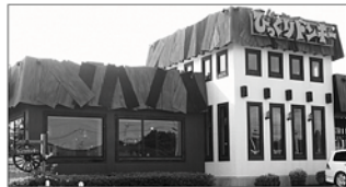
〈びっくり〉成田市ウイング土屋106 TEL 0476-23-9335

レスの方が木製枠にはめられたアメリカ風メニューをテーブルに立てます。豊富な種類のハンバーグをサイズ別にセットで選べるシステムで、色々な組み合わせが楽しめるのが、何度来ても飽きない理由です。また値段もリーズナブルで、ハンバーグステーキは512円から932円まで12種類、オードブルは6種類のサラダからたこ焼きまで、どれをとっても良心的。しかもきびきびしたサービスは好感が持てます。家族で楽しむレストランとしては、是非ともリストアップしたい1店です。 総合評価★★★★☆