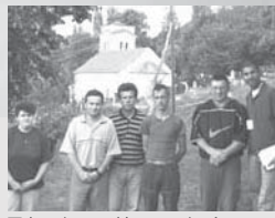
写真 / バンニャ村のセルビア人

コソボ紛争の前までは、スケンデライ・セルビツァ市(アルバニアの名前がスケンデライで、セルビアの名前がセルビツァです)にはセルビア人とアルバニア人が何世代にも渡りそれなりに共存していました。アルバニア人の自治権が奪われ、少数派であるセルビア人が多数派であるアルバニア人を支配するようになって、個人的には近所づきあいを続けながら、互いの家族の結婚式に呼び合う仲の人々もいたようです。しかしミロビッチ政権がコソボ以外のセルビア共和国からセルビア人治安警察をコソボに送り込み、アルバニア人を弾圧し始めるにいたって状況は変わり、人々の間は引き裂かれていったようです。そして紛争が終わったとき、もはや両民族は共存が続けられる状況ではなく、セルビツァ市の町に住んでいたセルビア人はすべて