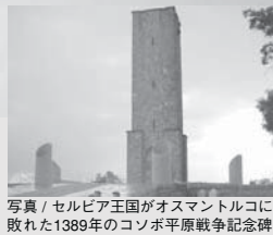
写真 / セルビア王国がオスマントルコに敗れた1389年のコソボ平原戦争記念碑

我々の目的は、アルバニア人とセルビア人が平和に共存できるコソボを作ることでした。日本でも、近所に住む隣人で考え方や生活習慣がぜんぜん違うので友人にはなれないが、相手の存在は認めるし、挨拶程度は交わすという人間関係はあるでしょう。せめて彼らにもその程度の隣人関係を築いてほしいと考えたのです。そのためは、どうすればよいのか。私が考えた道筋は、次のように段階的に和解を進めることでした。まず両者の代表同士が話し合いを持ち、セルビア系住民の帰還に合意する。ついで、セルビツァ市の元住民だったセルビア人が日帰りで町を訪れ、役所での仕事などもはじめる。両民族が日常の接触に慣れてきたらセルビア人が元の家に帰還する。大雑把に言って、この3段階で和解を進めていこうと考えたのです。しかし、彼らの代表といざ個別