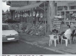
写真 / 市役所前のお店

皆様、新年、明けましておめでとうございます。前回まで書いてきたコソボにおける民族和解のプロセスはまだ継続中ですが、今回は新年ですので、コソボにおける年越しの話を書きます。コソボ戦争が起きたのは1999年の春でしたが、セルビア民兵によるアルバニア人襲撃とそれに対するNATOによるセルビア軍施設への空爆によって、コソボ全土が壊滅的な打撃を受けました。そういう状況下で8月にコソボに赴任した私が、越冬対策と市役所の再建に全力を傾注したことはこれまで書いてきたとおりです。12月に入ると本格的な冬が到来し、氷点下10度くらいの本当に寒い毎日が始まりました。それでも大晦日の夜に年越しのパーティを市役所の前で開かないかと提案してみました。おりしも時は1999年から2000年の大台に代わる、いわゆるミレニウム(1000年に