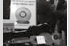
ウィナーのクリスタル・トロフィー (右下)