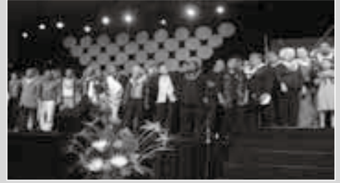
ラストではハワイのミュージシャンがステージに勢揃いし、ハワイ・アロハを歌い上げました。

スペシャル・コラボが幕を閉じました。終演後もまた大好きなアーティスト達と一緒に記念写真を撮ることが出来て、言葉、国籍、年齢も関係無く、世界共通の音楽というものの楽しさを心から味わう事が出来た大興奮の一夜でした。