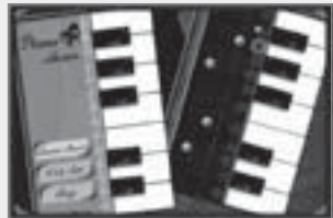
iPhone用の音楽関係のアプリだけでも1900以上も登録されている。