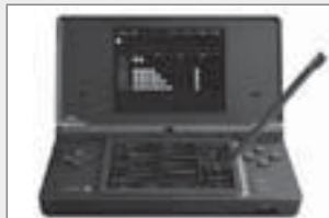
KORG DS-10は、DS用のシンセサイザーソフトとして評価が高い。

1990年代からポケットシーケンサーといって小型の自動伴奏機が市場に出回りましたが、DSi や iPhone のように、ゲームや電話がこれからの音楽制作の主流になる日も、そう遠くはないような気がします